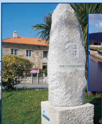
Roteiro Pondaliano Val Nativo Deseño de menhires (Anxo Cousillas e Adrián Varela).