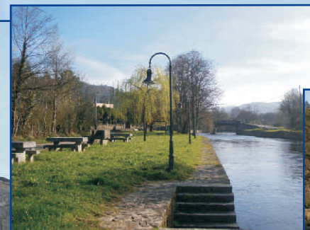
Campás con poesía. Campanas con poesía.

A enerxía, a riqueza e a beleza do río Anllóns.